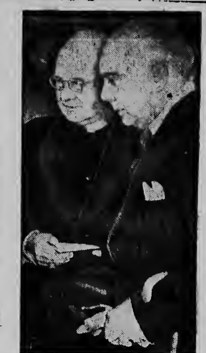
Kardinaal Spellman (links) met de Dominikaanse president Rafael Trujillo tijdens het Katholieke Culturele Congres dat in Sta. Domingo is gehouden.